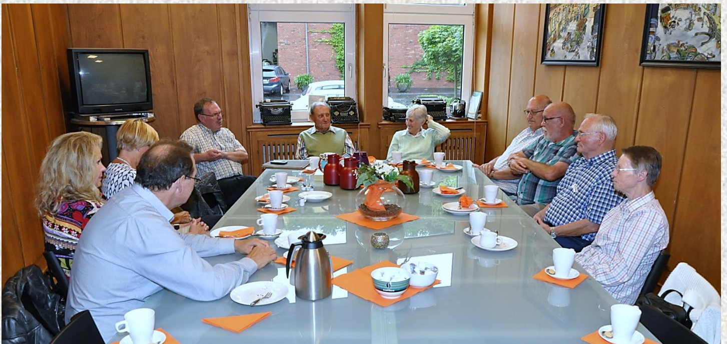
Zur Stärkung gab es nach dem Rundgang hervorragenden Kuchen und Kaffee!