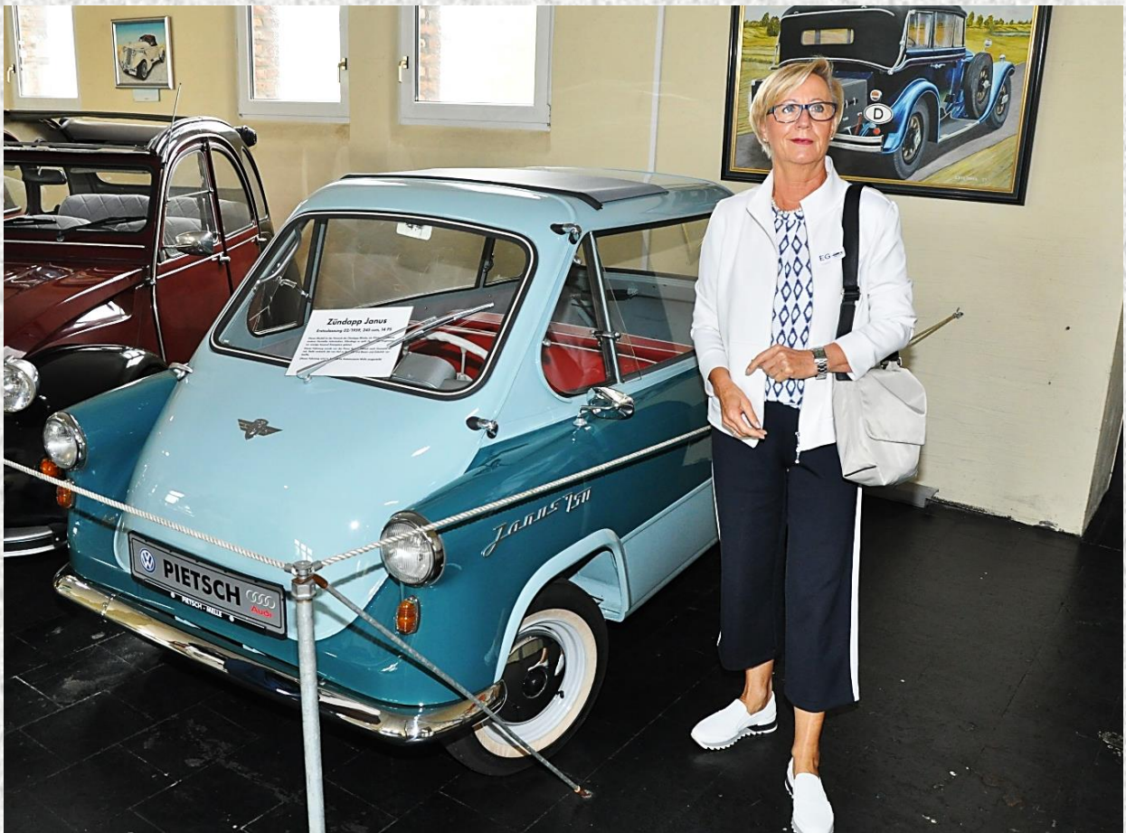
...hier das Auto, in dem ich als Kind mit meinem Großvater gefahren bin...