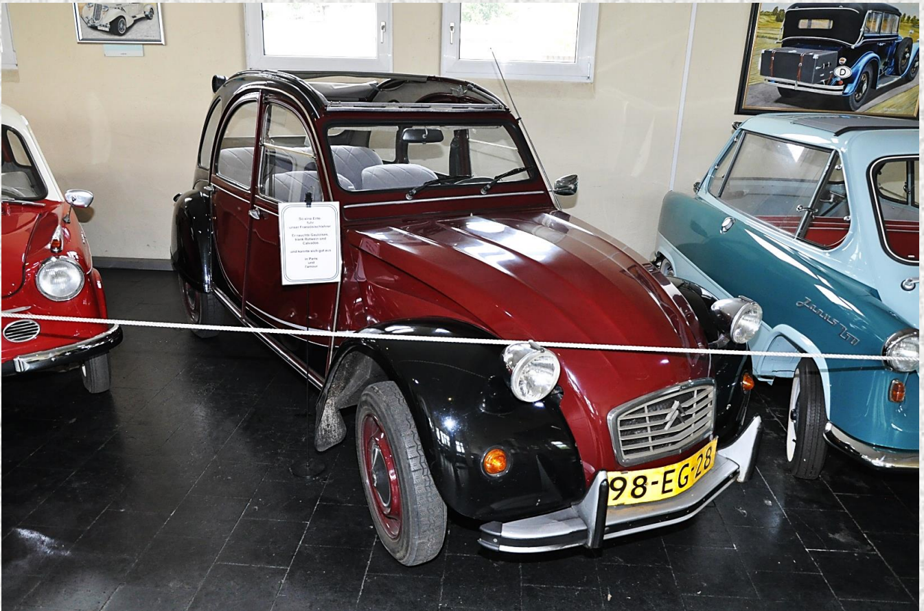
...Kult Auto „Ente“...