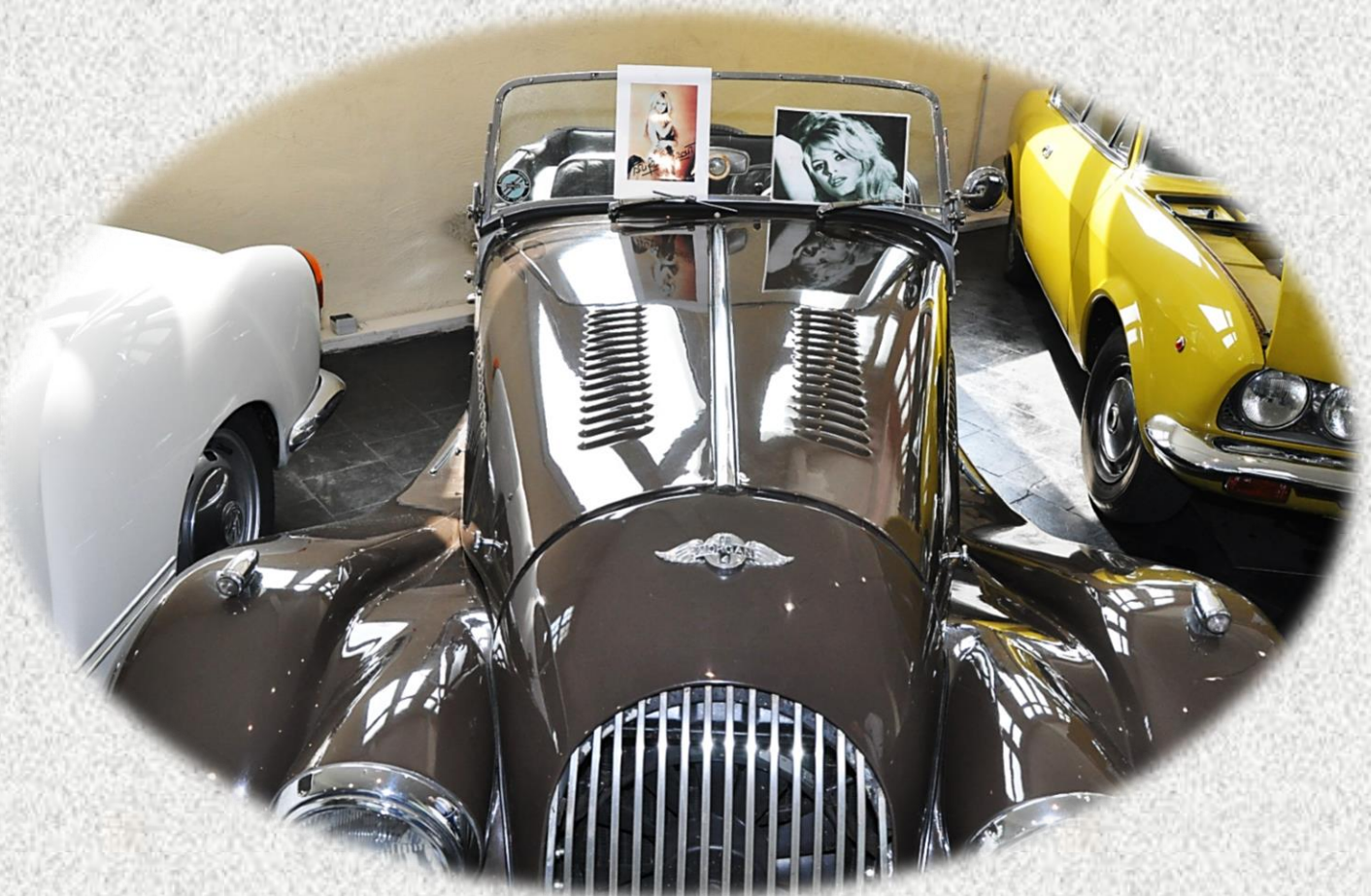
...hier das Original Auto, mit dem Brigitte Bardot in Saint Tropez spazieren gefahren ist...