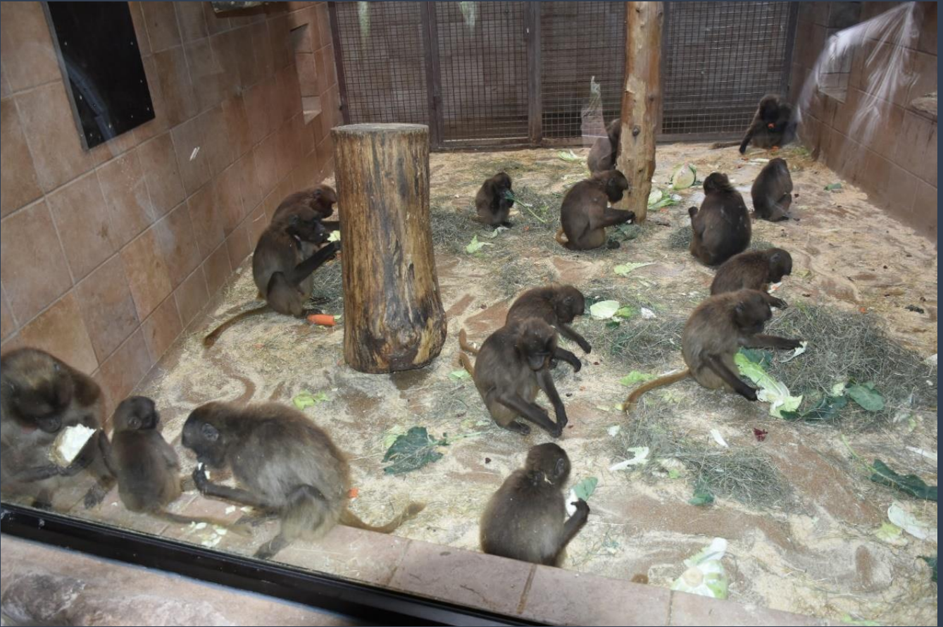
...etwas ganz besonderes, die Zooküche...